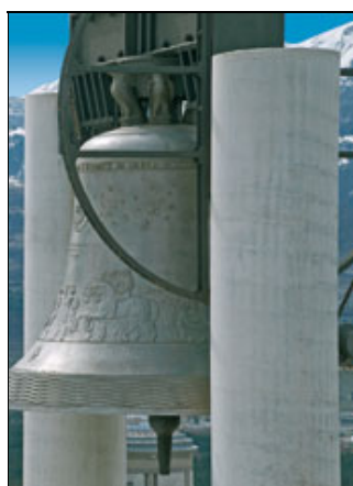
La Campana della Pace di Rovereto

Aung San Suu Kyi, Barack Obama e Lech Waęsa sono i tre Nobel protagonisti del concerto del 6 luglio 2012 a Rovereto